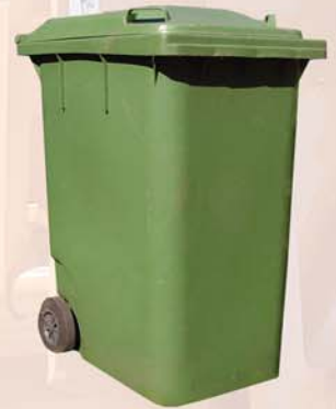
Todos los modelos