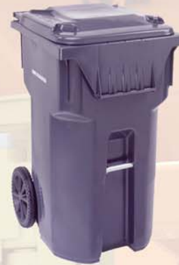
D6207 & 08 solamente