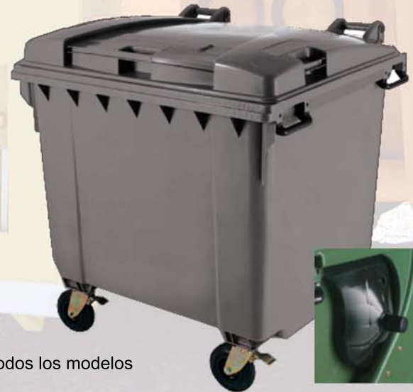
Todos los modelos