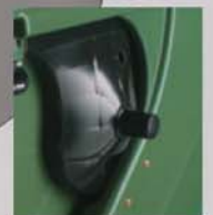
D6208 & 12 solamente

Perkins. Puestos a prueba en la ruta. aprobados por el operador.